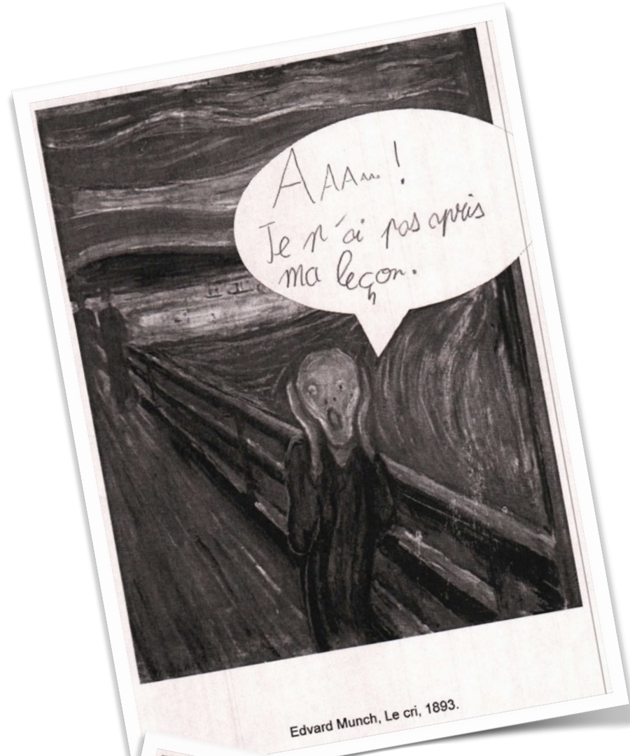
Edvard Munch, Le cri, 1893.