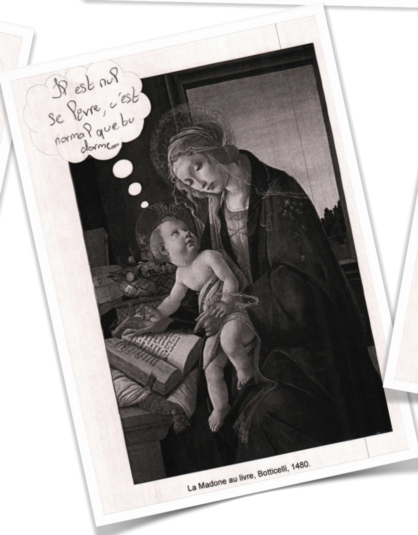
La Madone au livre, Botticelli, 1480.