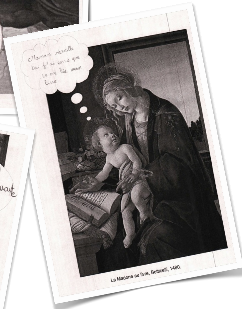
La Madone au livre, Botticelli, 1480.